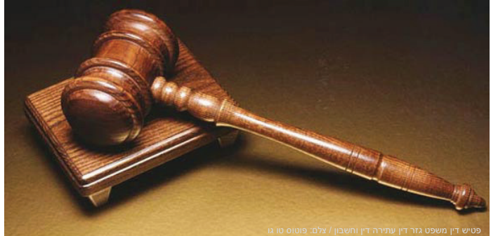
פטיש דין משפט גרדן עתירה דין וחשבון