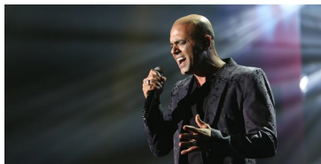
הותר לפרסום: נעצר חשוד בזיוף ההאזנות לאייל גולן

מיכל אגמון גונן מס הכנסה פקיד השומה רשות המסים שמועות מס נושאים למעקב <<